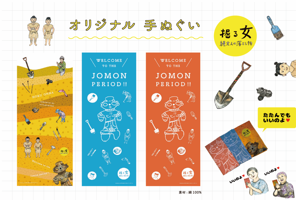
日本手ぬぐい（フルカラー・青・赤）