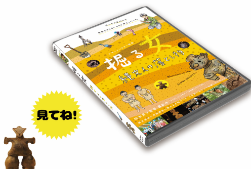
「掘る女 縄文人の落とし物」DVD